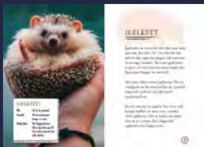
Ur Ovanliga husdjur

Det här är första boken i serien Saker du inte visste om ... En serie böcker med enkla texter och mycket bilder som är fyllda med oväntade fakta om roliga och aktuella ämnen.