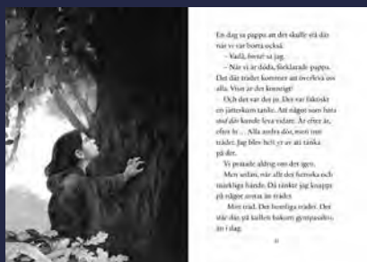
Ur Trädets hemlighet. Wilma