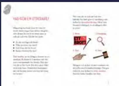
Ur En dag som utredare

En dag som utredare: En utredares jobb är att ta reda på om ett brott har skett och vilka som var med. Men hur är det egentligen att jobba som utredare? Vilka är utredarens viktigaste uppgifter? Få svar på dina frågor och följ med under en dag på jobbet som utredare!