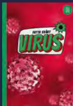
Virus 9-12 år 28 sid. ISBN 9789179710217

Virus kan påverka alla sorters levande organismer. Växter och djur, till och med pyttesmå bakterier, kan drabbas av virus. Men vad är egentligen ett virus och vad händer i din kropp om den blir infekterad? Detta och mycket mer får du veta i den här boken.