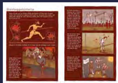
Ur Mot toppen. Armand Duplantis

Det här är första delen i en biografisk serie om olika äventyrar- och sporttalanger. Perfekt för ovana och ovilliga läsare som gillar sport, fakta och framgångssagor.