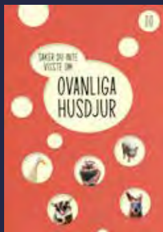
Ovanliga husdjur 9-12 år 28 sid. ISBN 9789179710255

Du vet kanske en hel del om Sveriges vanligaste husdjur, hund och katt. Men vad vet du om våra ovanligaste husdjur? Visste du till exempel att flygpungekorren är en mästare på att knyta upp knutar? Eller att minigrisar kan väga mer än en fullvuxen människa? I den här boken får du träffa några av våra ovanligaste husdjur och veta vad som gör dem så speciella.